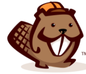
beaverbuilder WordPress sites in minutes, not months!