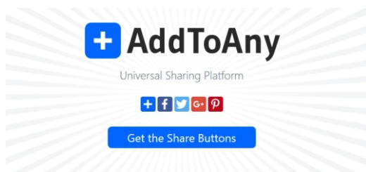
Add to Any